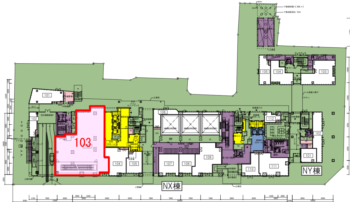
NX103 店 舗 414.32 m 2