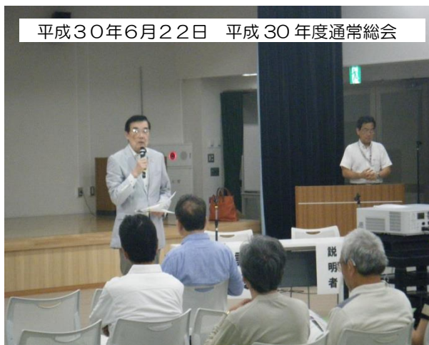
平成30年6月22日 平成30年度通常総会

平成30年6月22日（金）19時より文京区民センターにて、平成30年度通常総会が、組合員133名（内委任状出席91名）の出席のもと開催されました。