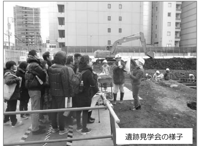
遺跡見学会の様子