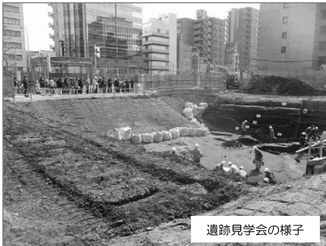
遺跡見学会の様子

昨年8月から実施していた埋蔵文化財調査（現地調査）が、今年3月に完了いたしました。本調査において、弥生時代中期の流路跡・水場遺構などが発掘されたため、今年2、3月と2回にわたり一般の方々に対して見学会を行いました。