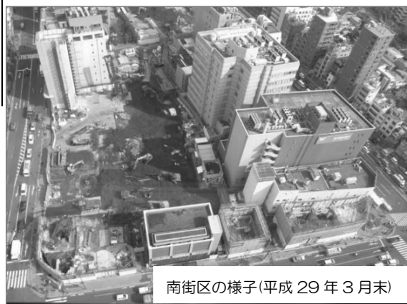
南街区の様子(平成 29 年 3 月末)

※竣工予定は、現段階での工事（外構等含む）完了時期を記載しています。 権利者の皆さまへの引渡し時期については、各施工者と調整後、別途定めお知らせします。